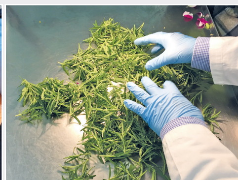
Rosmarin ist Wirtspflanze für Xylella fastidiosa Rosemary is host plant of Xylella fastidiosa

In 2015 and 2016, the potato brown rot bacteria Ralstonia solanacearum Race 1 occurred in several companies for cut roses. Eradication measures in the respective enterprises were promptly carried out with the technical advice of the Institute.