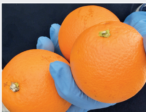
Untersuchung von Apfelsinen auf Phyllosticta citricapa Examination of oranges for Phyllosticta citricapa