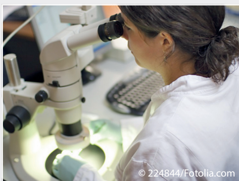
Referenzlabor für Quarantäne- und neue Schadorganismen Reference laboratory for quarantine and new pests

Das EU-System zur Pflanzengesundheit und zu amtlichen Kontrollen wird seit 2013 neu ausgerichtet. Das Institut war in die Erarbeitung der Verordnungen (EU) 2016/2031 und (EU) 2017/625 eingebunden, die ab 14.12.2019 anzuwenden sind. Es ist auch fortlaufend auf verschiedenen Ebenen an der Erarbeitung und Aktualisierung der Durchführungsrechtsakte und Verwaltungsvorschriften beteiligt. Hierfür sind auf Experten- und EU-Ratsarbeitsgruppenebene deutsche Positionen zu entwickeln, in die EU-Diskussion