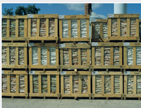
Verpackungsholz birgt Einschleppungsrisiko für Quarantäneschädlinge Wood packaging material bears the risk of introduction of quarantine pests