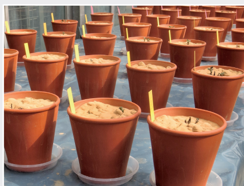
Projekt zur Inaktivierung von Kartoffelzysten-nematoden in Resterde Project for inactivation of potato cyst nematodes in soil residues