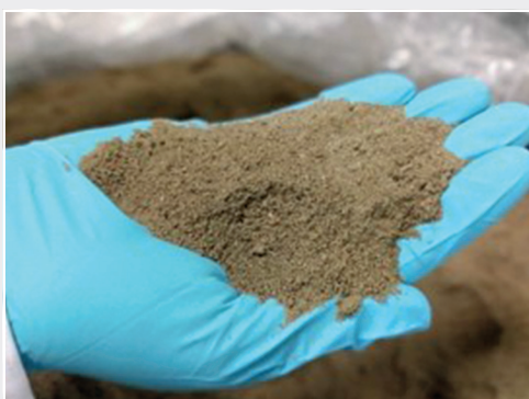
Risikofaktor: Resterde aus der Kartoffelverarbeitung Risk factor: Soil residues from potato processing

Schadorganismen können mit Reststoffen wie Erde aus der Kartoffelverarbeitung verbreitet werden, wenn diese in den landwirtschaftlichen Kreislauf zurück gelangen. In Kooperation mit der Universität Hohenheim und gefördert durch das Umweltbundesamt wurde die Wirksamkeit thermischer Klärschlammbehandlungsverfahren auf ausgewählte Pathogene der Phyto- und der Seuchenhygiene untersucht. Trotz der hygienisierenden Wirkung thermischer Verfahren konnte der Erreger des Kartoffelkrebses dabei nicht inaktiviert werden. Daher besteht ein hohes Risiko, dass sich dieser relevante Erreger bei der landwirtschaftlichen Verwertung von Reststoffen und -erden verbreitet. Verfahren, die zu einer vollständigen Inaktivierung dieses Schadorganismus führen, sind bisher nicht bekannt, so dass weitere Forschungen notwendig sind.