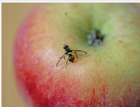
Bactrocera dorsalis – in der EU nicht etablierte Fruchtfliege Bactrocera dorsalis - fruit fly not established in the EU