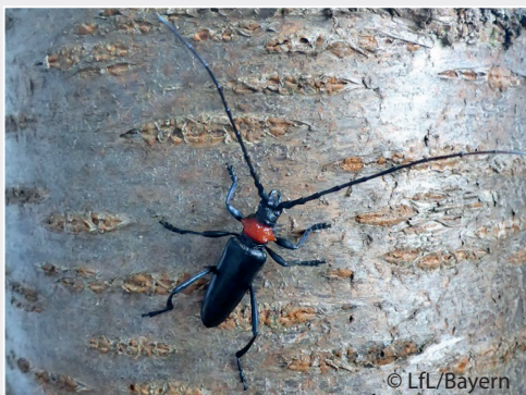
Aromia bungii mit hohem Schadpotenzial Aromia bungii with high potential for damage

2016 trat in Deutschland die Bakterienkrankheit Xylella fastidiosa ssp. fastidiosa erstmals auf. Befallen waren Topfpflanzen im Gewächshaus eines Betriebes. Das Institut führte bei Xylella die Referenzuntersuchungen durch und beriet die zuständigen Pflanzenschutzdienste zu den notwendigen Ausrottungsmaßnahmen entsprechend Durchführungsbeschluss (EU) 2015/789 und der Abgrenzung der Befalls- und Pufferzone. Zudem erstellte es in Abstimmung mit den