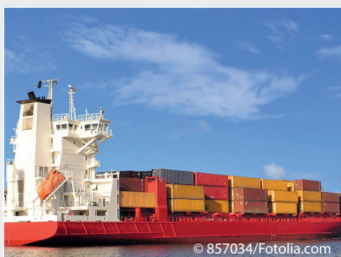
Weltweiter Handel mit Pflanzen und Pflanzenerzeugnissen nimmt zu Worldwide trade with plants and plant products is increasing

Das Institut ist die von Deutschland bei der Europäischen Union (EU) benannte nationale Koordinierungs- und Kontaktstelle für pflanzengesundheitliche Fragen im EU Rahmen nach Art. 4(2) der VO (EU) 2017/625 über amtliche Kontrollen. Es erstellt unter Einbeziehung der Pflanzenschutzdienste der Bundesländer und ggf. von Wirtschaftsverbänden Notfallpläne und Leitlinien, die vorgeben, wie Schadorganismen erkannt und pflanzengesundheitliche Maßnahmen durchgeführt werden sollen. Das Institut koordiniert für den Bereich Pflanzengesundheit die Erstellung und Weiterentwicklung der Integrierten Mehrjähri-