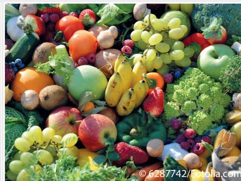
EU-Projekt DROPSA hat Ein- und Verschleppungsrisiko für Obstschadorganismen untersucht EU project DROPSA investigated the risk of introduction and spread of quarantine pests of fruits

risk exists that this relevant pathogen is distributed via agricultural use of residues and residual soil. Methods that lead to a complete inactivation of this harmful organism are not yet known so that further research is necessary.