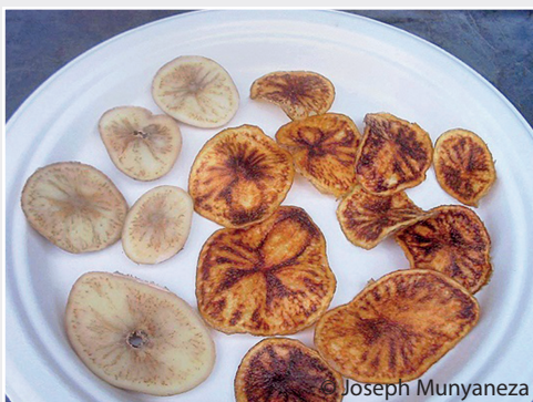
Zebra-Chips, verursacht durch Candidatus Liberibacter solanacearum Zebra chips caused by Candidatus Liberibacter solanacearum