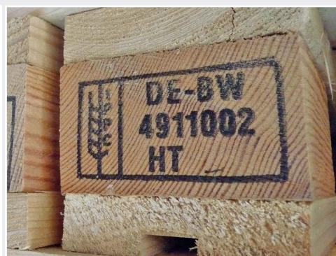
Die ISPM 15 Markierung kennzeichnet weltweit behandeltes Verpackungsmaterial aus Holz Worldwide, the ISPM 15 mark stands for treated wood packaging material

the Institute contributes in the development of German positions, their introduction in EU-discussions as well as in the implementation of the regulations in Germany.