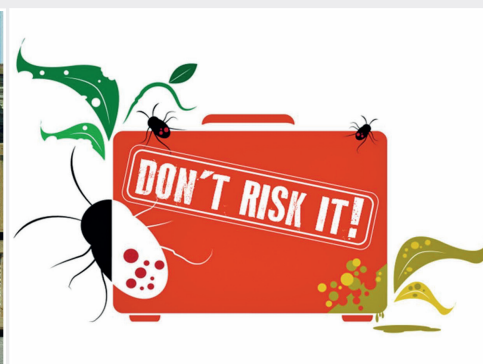
Pflanzliche Souvenirs: Geh kein Risiko ein Plants and plant products as souvenirs: Don't risk it