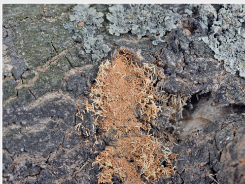
Fraßrückstände holzzerstörender Insekten als Grundlage für deren Identifizierung Feed residues of wood-destroying insects as basis for their identification

Im Fokus des vierjährigen EU-Projekt DROPSA stand die Erforschung und Verminderung des Risikos der Einschleppung und Verbreitung von Obst-Schadorganismen, die für die Länder der EU an Bedeutung gewinnen oder neue Bedrohungen darstellen. 26 Projektpartner aus Europa, Nordamerika, Ozeanien und Asien bestimmten die Ein- und Verschleppungswege der Kirschesigfliege ( Drosophila suzukii ), des Kiwikrebses ( Pseudomonas syringae pv. actinidiae ) und weiterer obstschädigender Organismen und erarbeiteten Bekämpfungsmaßnahmen. Das Institut hat innerhalb des Forschungsprojektes maßgeblich am Arbeitspaket zur Erstellung von Warnlisten möglicher Schadorganismen, die mit Früchten in die EU eingeschleppt werden könnten, mitgewirkt.