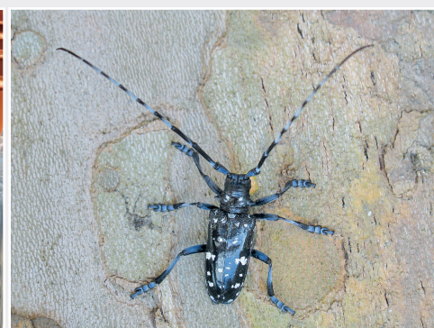
Anoplophora glabripennis , einer der schädlichsten Quarantäneschadorganismen der EU Anoplophora glabripennis is among the most harmful quarantine pests of the EU