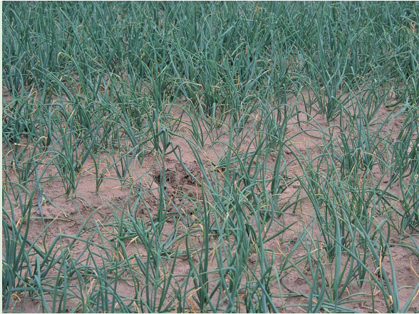
Lückiger Bestand nach Befall mit Meloidogyne hapla