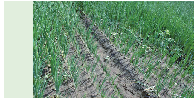
Lückiger Bestand bei Befall mit Trichodorus

Oberirdisch: Erhebliche Wachstumsschäden bis hin zu Pflanzenausfällen; Befallsnester oftmals deutlich von nicht befallenen Flächen abgegrenzt; innerhalb dieser Nester wechseln sich größere und kleinere Pflanzen ab.