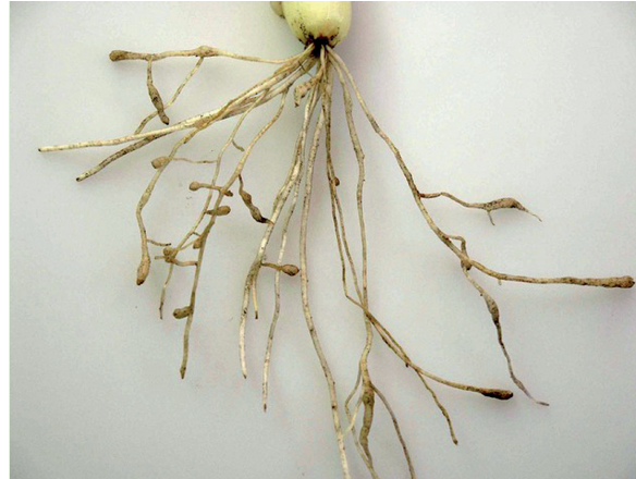
Wurzelgallen bei Befall mit Meloidogyne chitwoodi