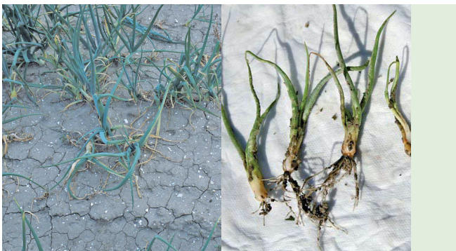
Symptome eines Befalls mit Ditylenchus dipsaci

Für Ditylenchus dipsaci sind verschiedene Rassen beschrieben, die sich in den bevorzugt befallenen Kulturpflanzenarten unterscheiden. Aufgrund dieser Rassenproblematik ist eine Fruchtfolgeplanung schwierig. In jedem Falle sollte auf Befallsflächen neben Zwiebeln und Kartoffeln auf den Anbau von Erbsen, Garten- und Feldbohnen verzichtet werden. Letztere Kulturen sind sehr gute Wirtspflanzen für D. dipsaci und führen zu einer starken Vermehrung der Nematoden ohne selbst Symptome eines Befalls zu zeigen. Demgegenüber führt der Anbau von Weizen und Zichorie in der Regel zu einem Befallsrückgang. Je schwerer der Boden, desto länger sollte die Anbaupause sein.