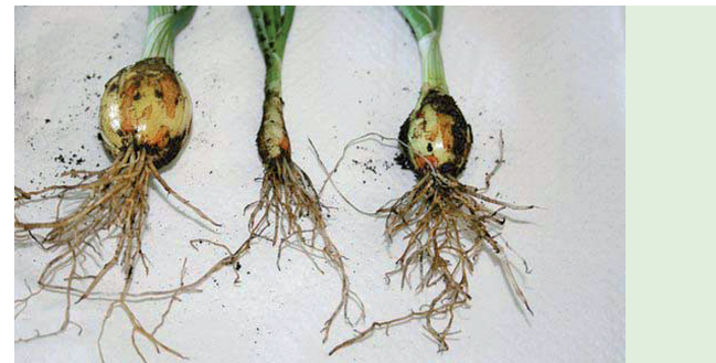
Schadbild von Trichodorus an Zwiebel

Unterirdisch: Wurzeln zeigen stoppeligen Wuchs, d. h. Wurzelspitzen sind verkürzt und verdickt und stehen seitlich ab.