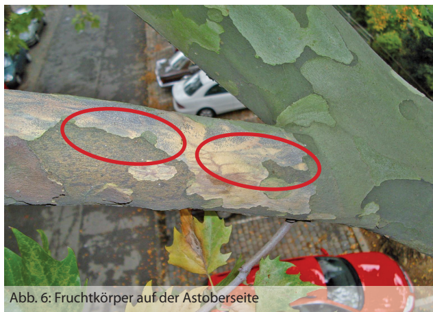
Abb. 6: Fruchtkörper auf der Astoberseite

Von einer vorsorglichen Kappung der Platanen ist aus fachlicher, baumbiologischer und stadtgestalterischer Sicht abzusehen.