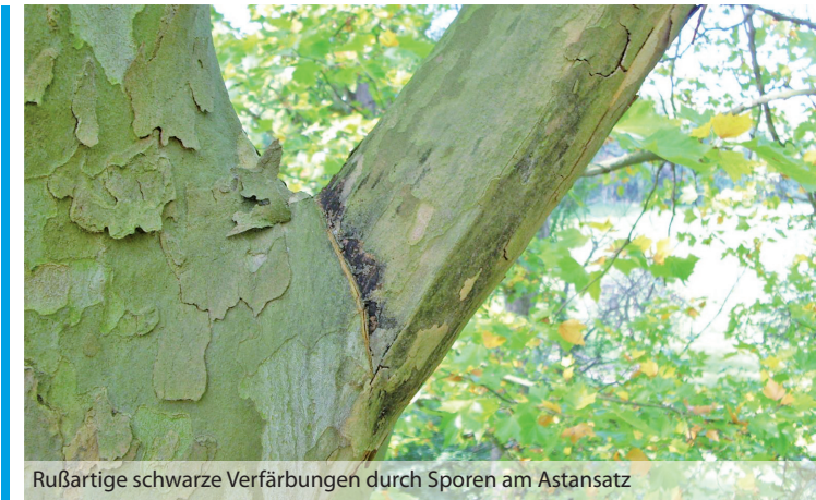
Rußartige schwarze Verfärbungen durch Sporen am Astansatz

Splanchnonema platani (Ces.) M.E. Barr 1982