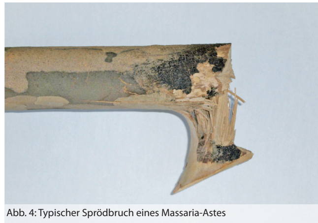
Abb. 4: Typischer Sprödbbruch eines Massaria-Astes