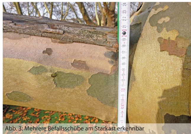
Abb. 3: Mehrere Befallsschübe am Starkast erkennbar