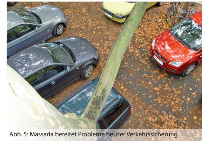
Abb. 5: Massaria bereitet Probleme bei der Verkehrssicherung

Ein Absterben ganzer Bäume konnte bisher nicht beobachtet werden. Ein Befall des Stammes stellt eine absolute Ausnahme dar.