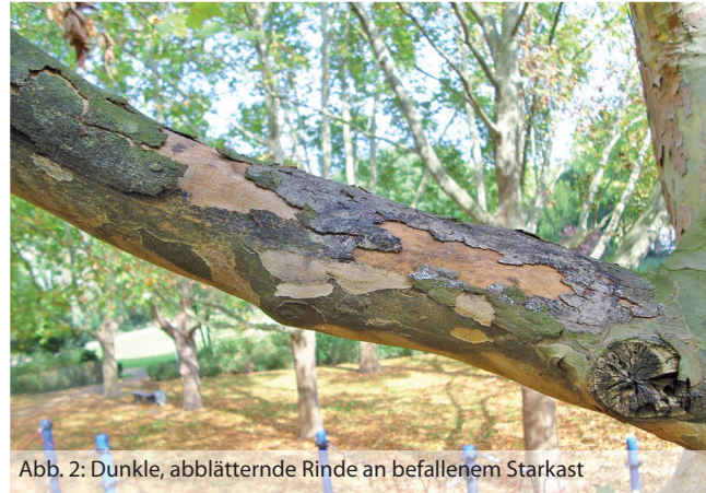
Abb. 2: Dunkle, abblätternde Rinde an befallenen Starkast