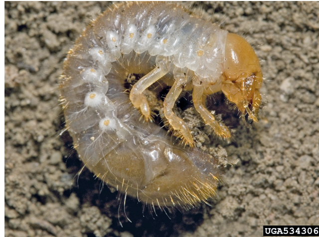
3. Popillia japonica - Larve