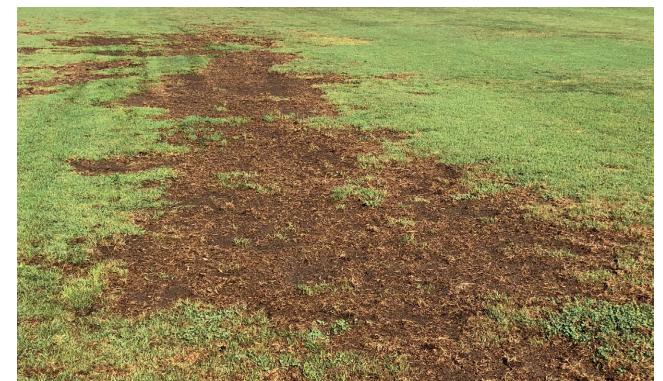
4. Schaden an einem Fußballplatz durch die Larven des Japankäfers im August (Mendrisio, Tessin, Schweiz)

Zierpflanzen: Rosa sp. (Rose), Wisteria sp. (Blauregen), Calluna vulgaris (Heide), Dahlia sp., Aster sp., Zinnia sp., Syringa sp. (Flieder), Virburnum sp. (Schneeball) u.a.