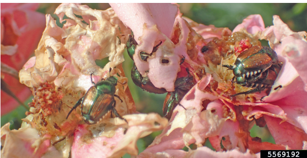
7. Fraßschäden an Rosenblüten