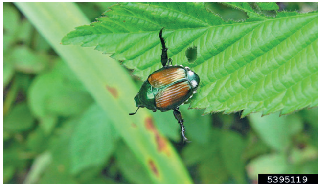
2. Typisches Verhalten des Japankäfers bei Gefahr

Die Engerlinge (Larven) unterscheiden sich von anderen Engerlingen durch v-förmig angeordnete Borsten am hintersten Körpersegment. Die Puppe gleicht der Form nach einem erwachsenen Käfer.