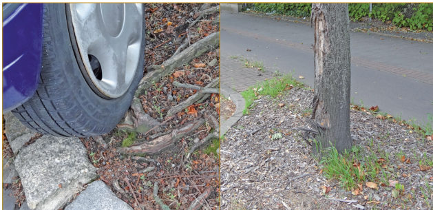
Abb. 6 - 7: Wurzelverletzungen und Stammschäden sind Eintrittspforten für Pilzsporen