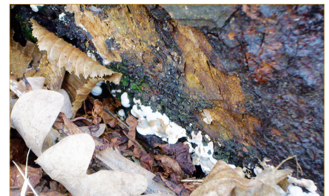
Abb. 4: Helle Fruchtkörper der Nebenfruchtform tief am Stammfuß