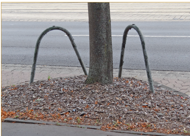
Abb. 8: Baumbügel können Schäden an Wurzeln und Stamm verhindern